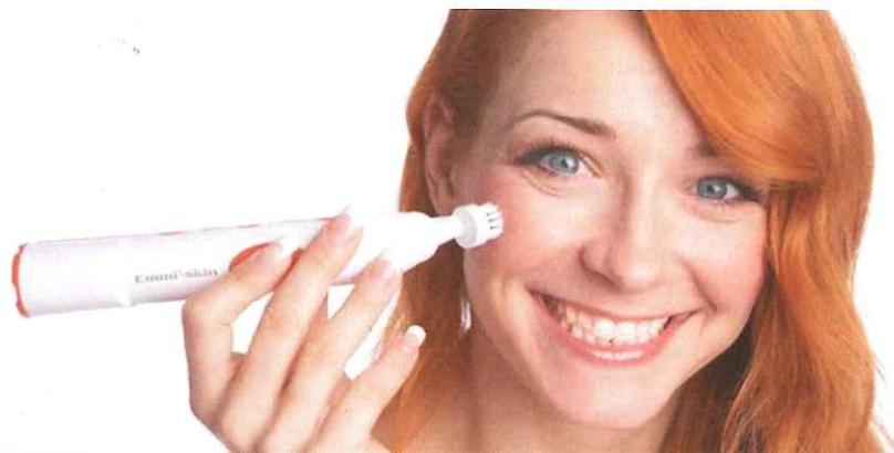
Schöne, straffe, gut durchblutete Gesichtshaut durch Anti Ageing Behandlung mit Ultraschall.